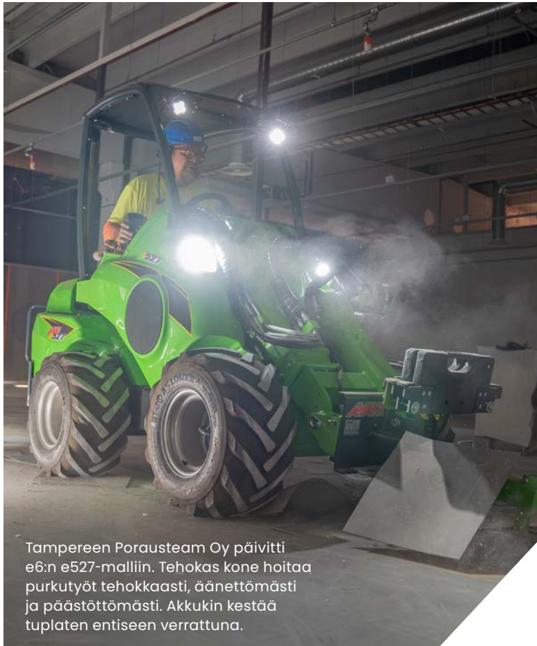
Tampereen Porausteam Oy päivitti e6:n e527-malliin. Tehokas kone hoitaa purkutöitä tehokkaasti, äänettömästi ja päästöttömästi. Akkukin kestää tuplaten entiseen verrattuna.

”Sähkökoneessa on tietysti vielä sekin hyvä puoli, että se ei pidä ääntä, vain työstä syntyy ääniä”, Sakari lisää.