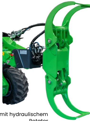
mit hydraulischem Rotator

Der neue schwere Holzgreifer ist mit einem stärkeren Arm, einem hydraulischen Rotator und einem größeren Greifwinkel aufgebaut. Speziell für den Einsatz an der 700er und 800er Serie entwickelt. Der Distanzhalter am Arm vorne montiert gehört zum Standard. Beim Baumfällen kann man den Baum auch damit wegdrücken, wenn es notwendig ist. Damit entfällt das Drücken von Hand. Es ist auch möglich Seile daran zu verspannen um den Baum zu ziehen.