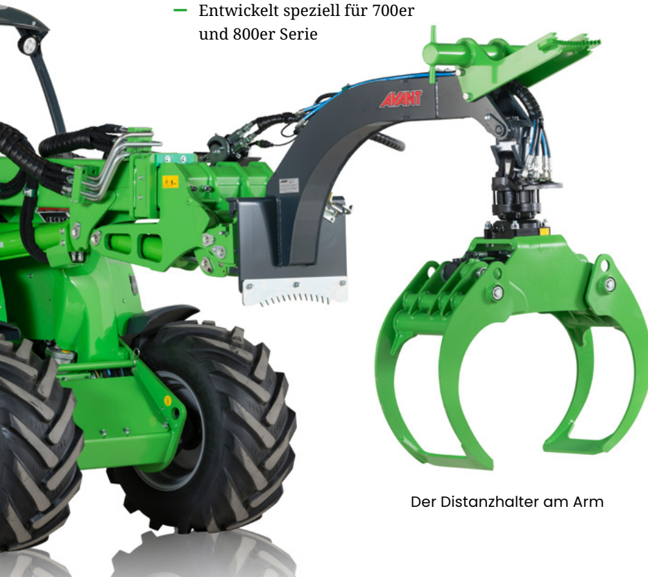
Der Distanzhalter am Arm

Es gibt auch 2 Holzgreifermodelle, die direkt an der Geräteanbauplatte des Laders montiert werden – einmal mit hydraulischem Rotator und einmal ohne Rotator. Alle 3 Modelle besitzen die gleichen Greiferschalen.