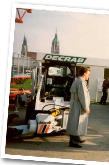
Die BAUMA 1992 in München war der große Startpunkt für den Erfolg von Avant in Deutschland.

Wir sahen schnell, dass sich die Dinge nicht in eine gute Richtung bewegten. Wir fingen an, uns mit dem Export zu beschäftigen und sahen, dass in Deutschland in weniger als einem Jahr die Baumaschinenmesse Bauma stattfinden würde. Zusammen mit Keijo Rekola hatten wir bereits begonnen, die nächste Generation von Ladern zu entwerfen und beschlossen, die neue Maschine auf der Bauma zu präsentieren.