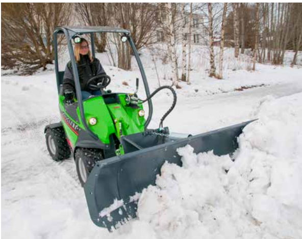
Puskulevy ja Avant 220.