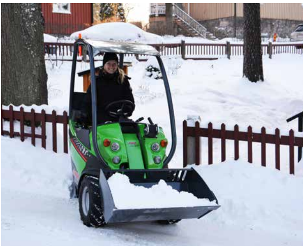
Lumikauha ja Avant 225.

Avant on tunnettu tehokkaana ja monipuolisena lumityökoneena. Lunta voi siirtää ja kuormata tai lingota suuriakin määriä nopeasti. Myös hiekoitus onnistuu kätevästi. Valikoimasta löytyvät kuormaajat ja niihin sopivat työlaitteet niin pientalojen pihojen ja pihateiden hoitoon kuin kiinteistönhoidon ammattilaisillekin.