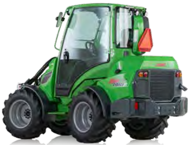
Höhe mit Kabine 2230 mm