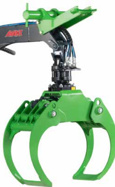
Puomilla varustettu HD-puutavarakoura