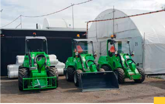
Hervey Bayn nykyiset kuormaajat rivissä – entiset 700-sarjan kuormaajat ja uusi 860.