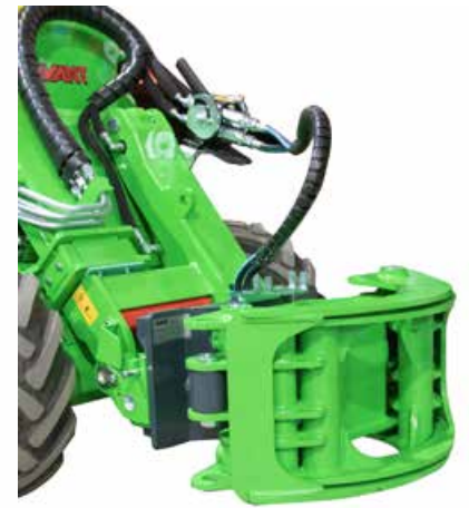
Puukoura ilman kouran kääntöä