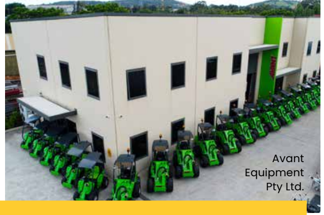
Avant Equipment Pty Ltd.