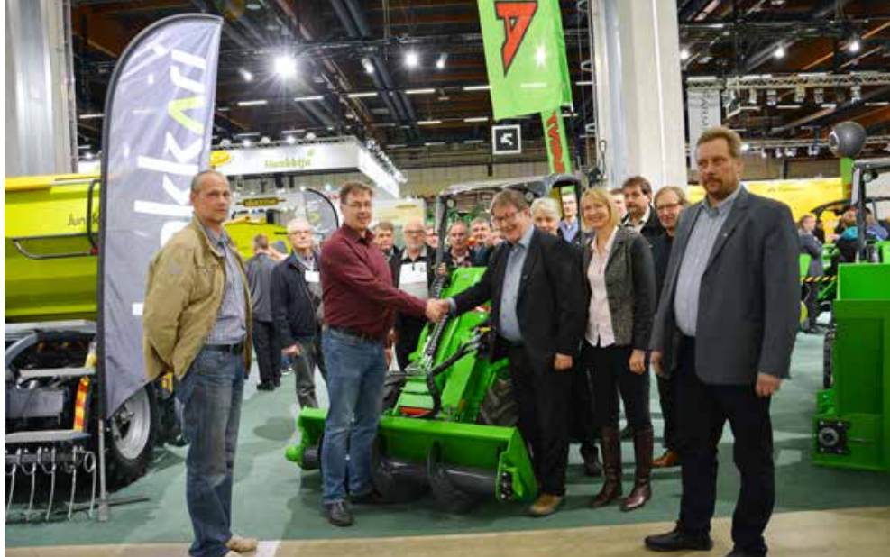
Oripään Lions Club vastaanotti uuden Avant 745 -kuormaajansa Helsingin maatalouskone-näyttelyssä 17.11.2018