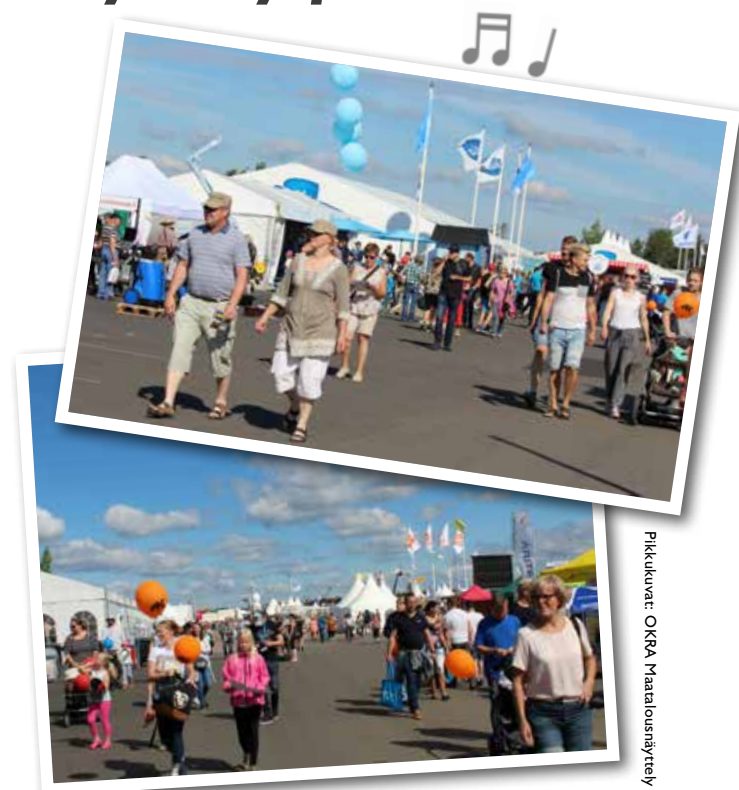
Pikkukuva: OKRA Maatalousnäyttely

”Avant 745 soveltuu ketteränä mutta voimakkaana koneena hyvin näyttelyrakentamiseen, muun muassa logistisiin tehtäviin